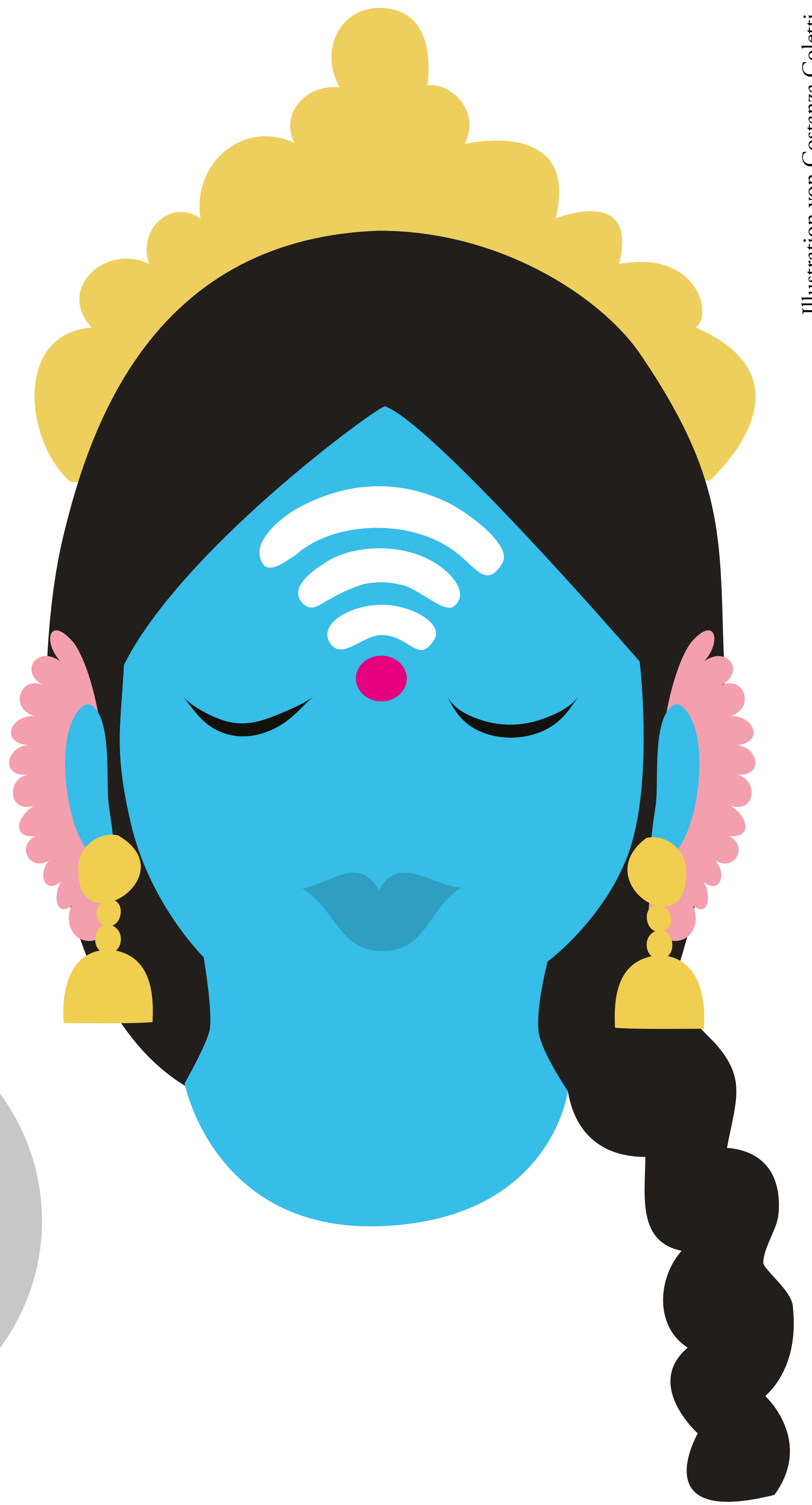
Illustration von Costanza Coletti

Ausstellung im Rahmen der 10. Kölner Indienwoche